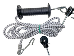
Fjädergrind 3,5 meter